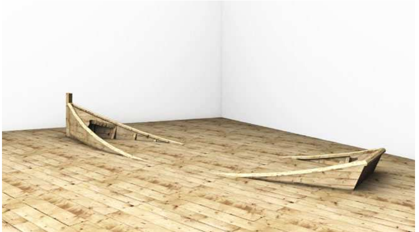
Crue , 2010 – maquette du projet – © Stéphane Thidet

Stéphane Thidet se sert des paradoxes tels que le jeu et le rite, le manque et le doute, l'inquiétante familiarité, le renversement des données temporelles. La deuxième exposition personnelle à la galerie de Stéphane Thidet articule ses dernières pièces en explorant la mise en péril comme champs des possibles.