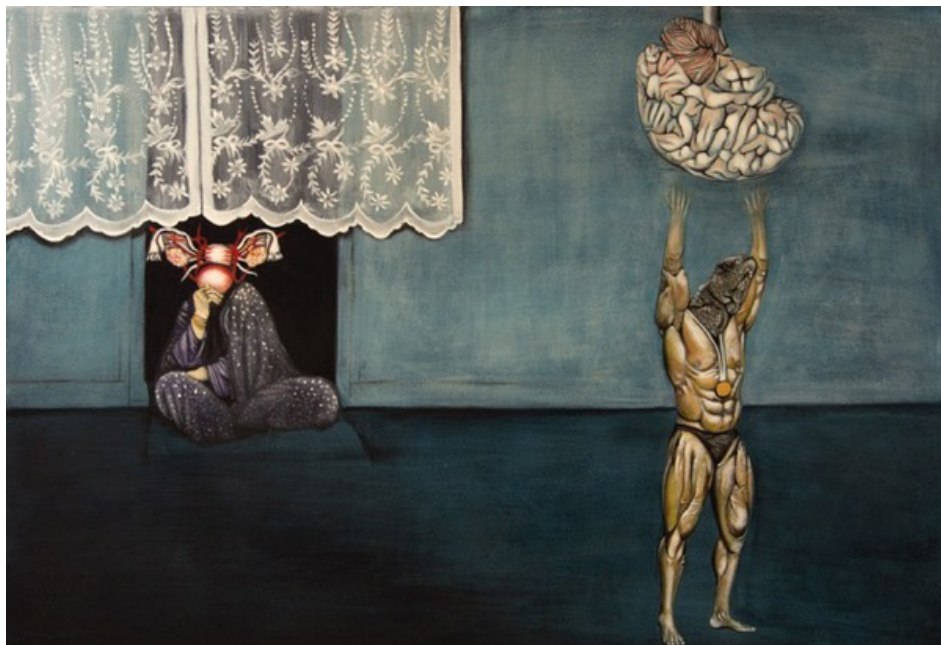
Sans-titre , Série « TAN », 2016 40 x 60 cm, Peinture à l'huile sur bois