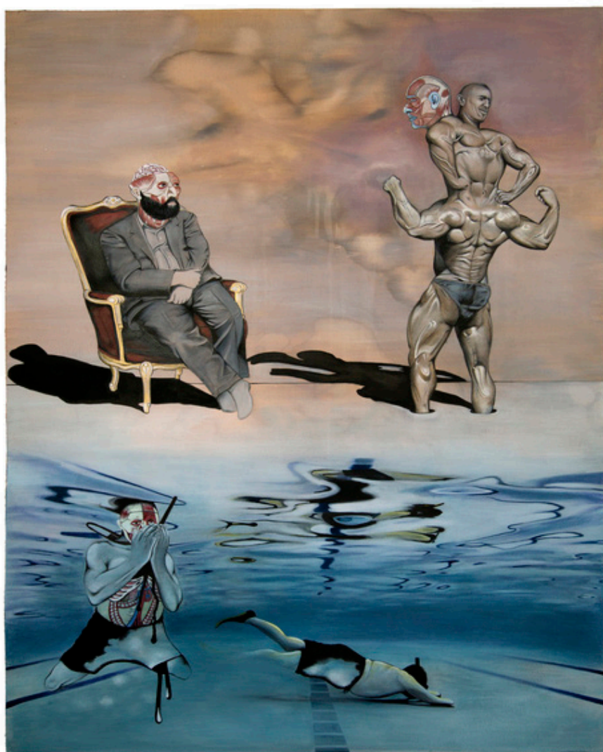
Sans-titre, série « TAN », 2016, Technique mixte